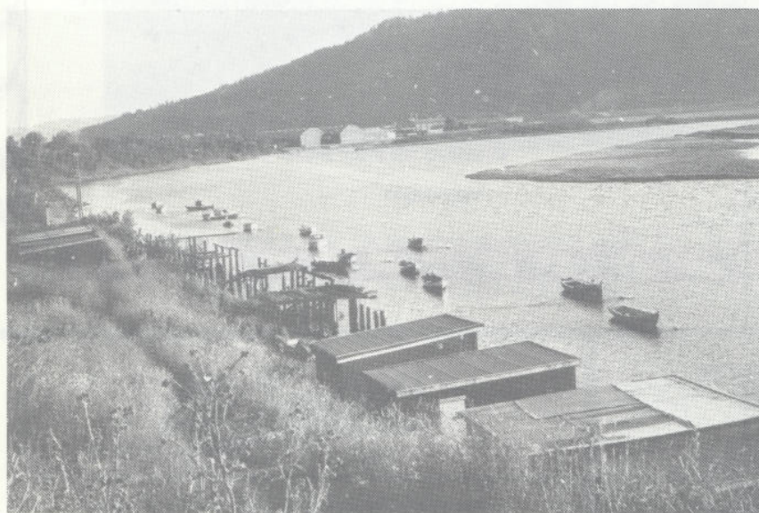
På grunn av det fine høstværet ligger ennå mange småbåter ute.