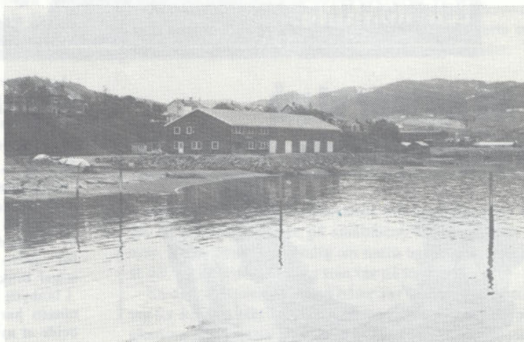
En del av området for småbåthavna med båthuset i bakgrunnen.

Ferdig utbygd småbåthavn vil gi plass til 560 båter og skulle således være stor nok i lang tid framover.